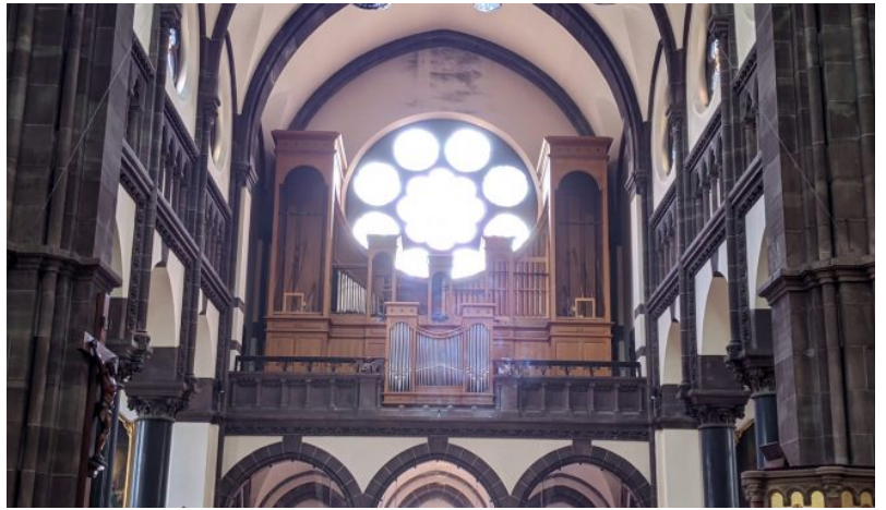
Le buffet de l'orgue vidé de ses tuyaux

En réalité pendant les travaux, le Récit expressif et le Positif de dos restent jouables pour la célébration des offices assurant un accompagnement minimal pour la beauté des offices.