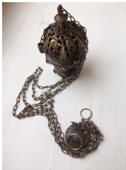
Encensoir en bronze, initialement argenté