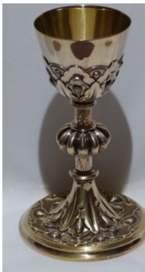
Calice en argent plaqué or fin du 19 ème siècle

En 2021 nous devons poursuivre cette action et nous allons nettoyer et rénover un calice ancien et sa patène ainsi qu'un encensoir très encrassé par l'usage.