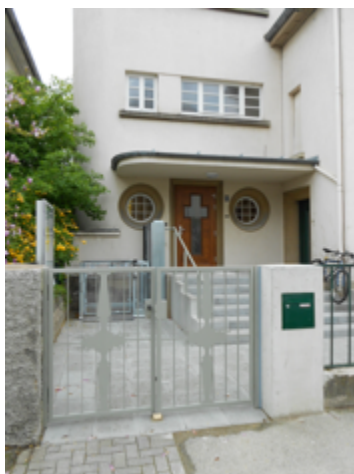
Le nouveau portail d'entrée

Faute de mise en conformité tant en matière de sécurité qu'en ce qui concerne l'accueil des personnes à mobilité réduite, il n'aurait plus été possible d'accueillir du public ni d'héberger les activités des scouts, dans l'immeuble de la rue Léon Boll.