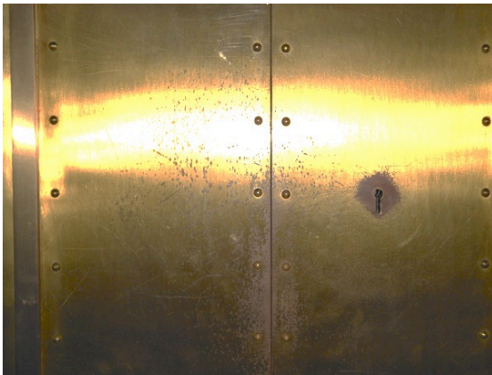
État de la porte avant restauration

Avec le temps, le revêtement de la porte du tabernacle s'était passablement dégradé, au point qu'il n'était plus digne du respect dû à la présence eucharistique. Une restauration s'imposait ; encore fallait-il trouver l'art et la manière.