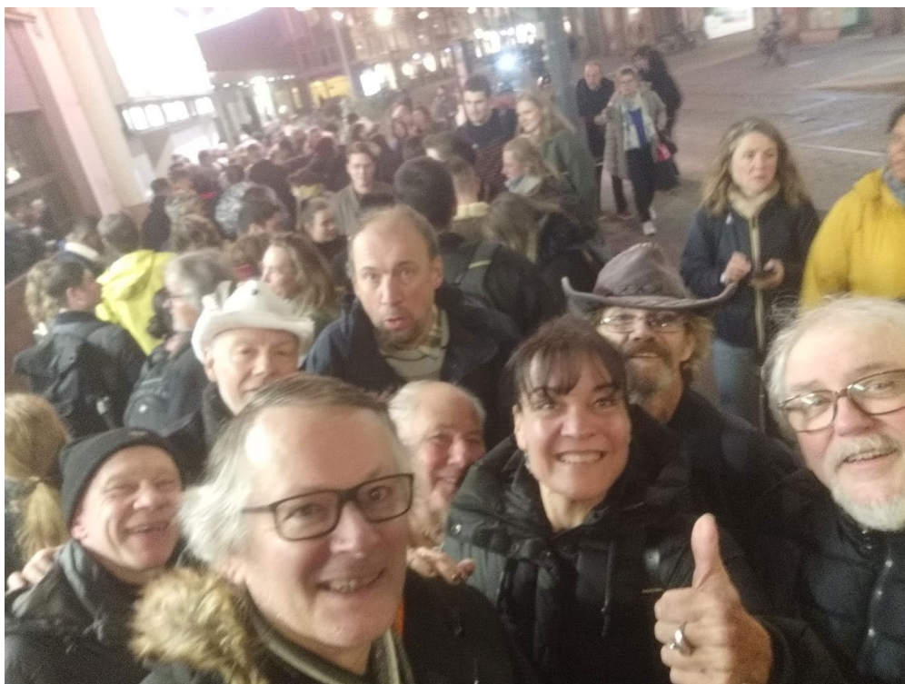
Les Maraudeurs du Sacré-Cœur (12 personnes) le jeudi 13 novembre, dans la file d'attente du cinéma Vox pour le film Sacré-Cœur.